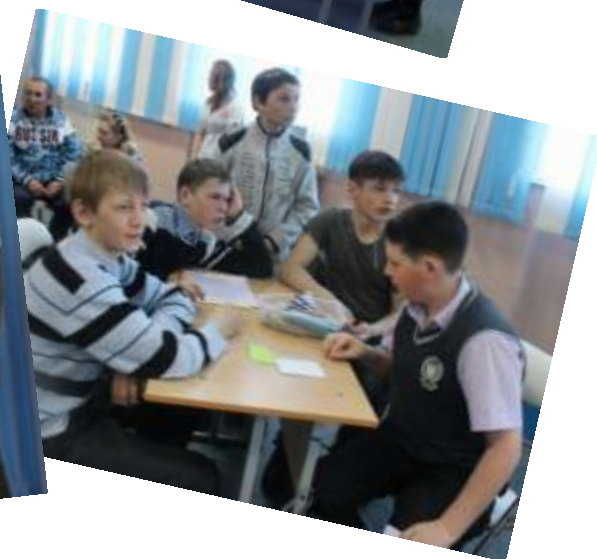
Над выпуском работали: Галкина Анастасия, Харисова Арина, Новоселов Владислав, Прилукова Венера.